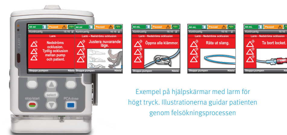
Exempel på hjälpskärmar med larm för högt tryck. Illustrationerna guidar patienten genom felsökningsprocessen

Hjälpskärmar med pumplarm stödjer felsökning för att lösa larmtillstånd med guidade skärminstruktioner. Dessa skärmar kan bidra till att minska behovet av hembesök av sjukvårdspersonal samt bibehålla infusionens kontinuitet.