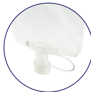
Öppningsbar port med lock